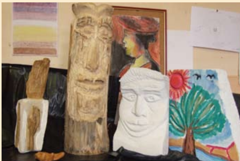
Réalizations de l'atelier d'art thérapie

Cette étape espère amener le résident à une meilleure connaissance et acceptation de lui-même dans sa réalité avec ses souffrances , mais aussi avec ses appuis et ses fragilités et donc ses besoins et l'aider à faire des projections réalistes pour le futur .