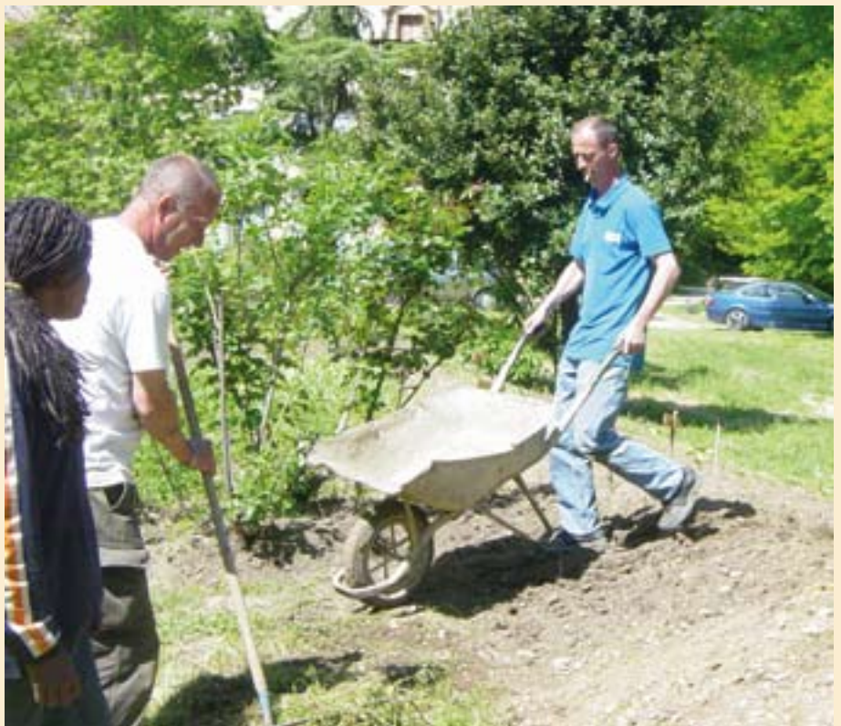
Le chantier potager - espaces verts