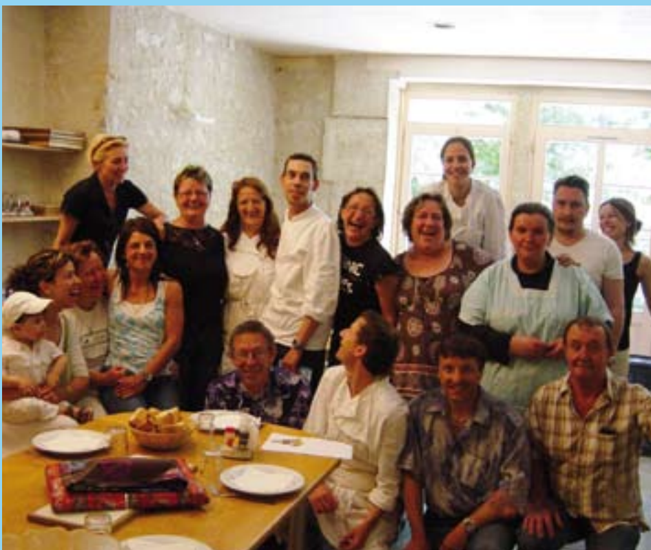
L'équipe de l'atelier

13 salariés en contrats aidés (CA / CAE) travaillent dans cet atelier. ■