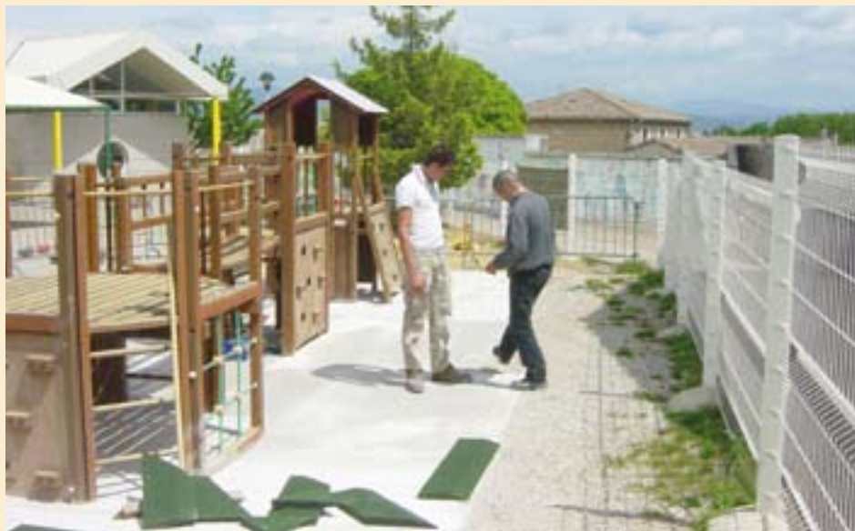
Travaux à l'école de Grâne